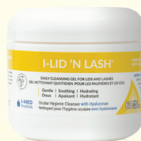
60 lingettes préimbibées